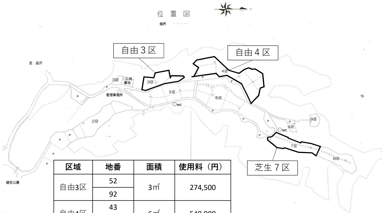
奥卯辰山墓地公園 位置図