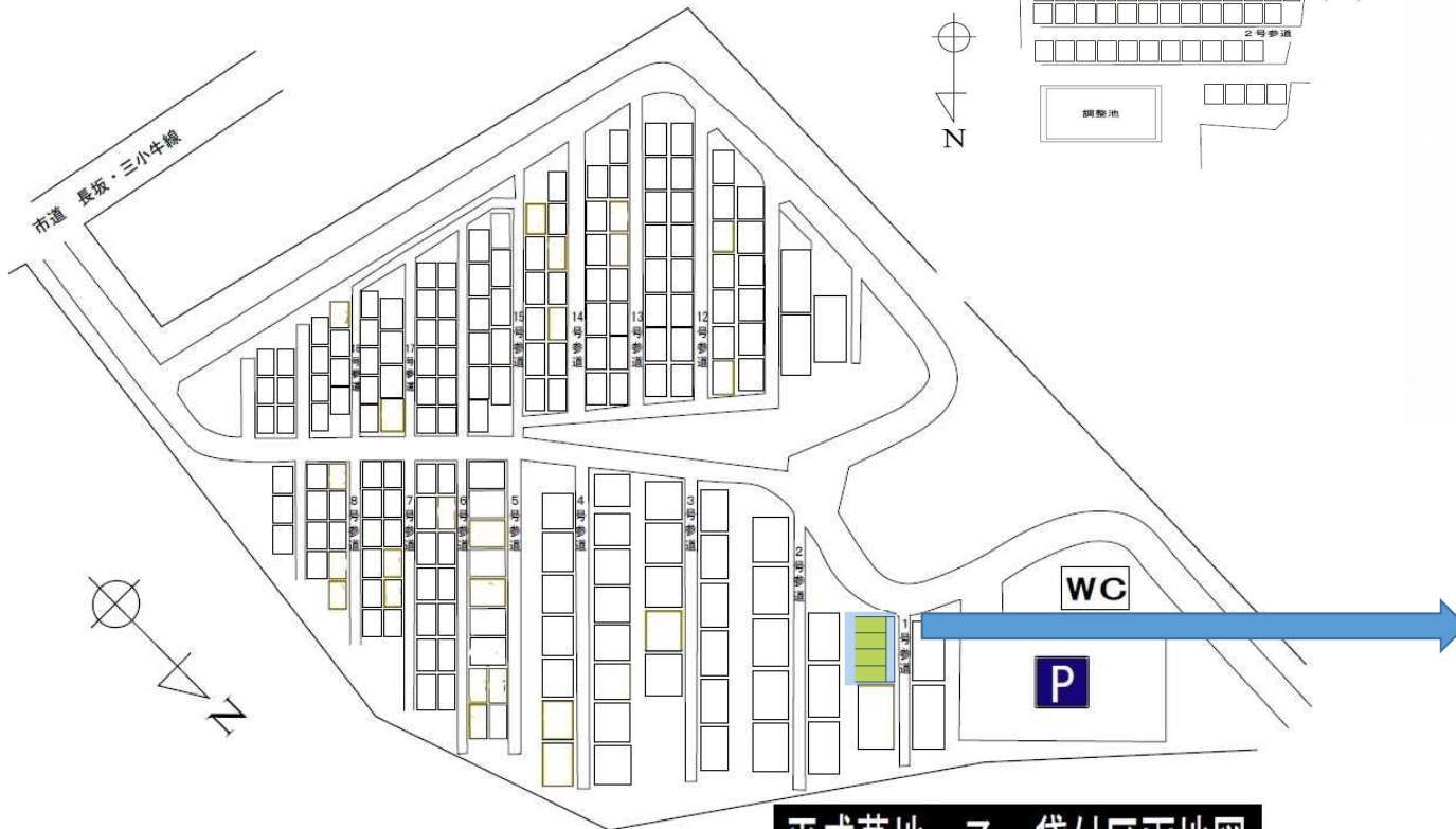
平成墓地 乙 貸付区画地図